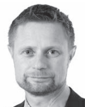
Bent Høie, helse- og omsorgsminister