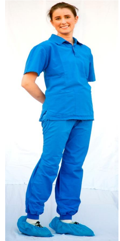
Illustrasjonsfoto – personen er modell